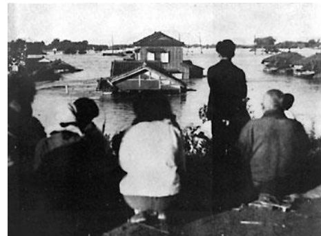
カスリーン台風による荒川決壊で冠水した地域の写真

この時のワコーレ周辺の水位が 2m 強と言われています。熊谷で決壊してから、鴻巣市笠原に達するまでに約半日かかっています。つまり、カスリーン台風