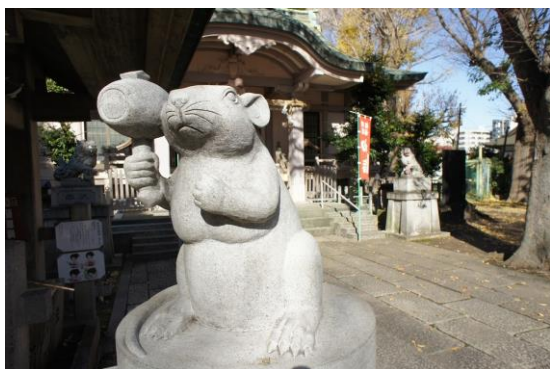
戸部杉山神社の狛犬（横浜市）