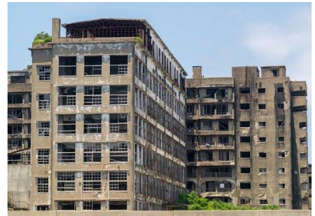
廃墟化したマンション

空室率が高まりマンション役員のなり手不足が進み、修繕積立金の滞納が増加してくると、マンションは管理不全に陥り、健全な修繕、営繕が行われなくなり、修繕が困難な限界マンションが増加して、最終的には廃墟に帰すといわれています。現在、廃墟化したマンションはまだ多くありませんが、年々老朽化は進んでいきます。日常営繕は当然ですが、定期的に足場を掛け通常は出来ない大規模修繕で補修することが、建物の老朽化対策として重要です。さらに、永住を望む居住者が増えてきていることから、快く住めるような改修を行うことが重要になってきています。